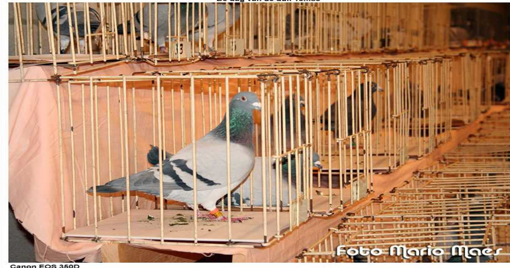
De dag van de duif Temse

Ben je op zoek naar iets nieuws? Regionale, provinciale & nationale kampioenen bieden duiven te koop aan. Voor ieders budget mooie aanbiedingen.